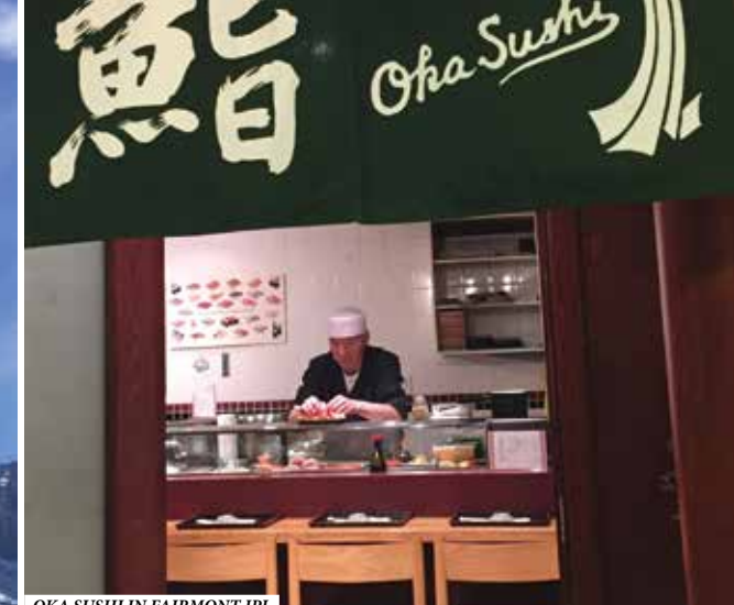
OKA SUSHI IN FAIRMONT JPL