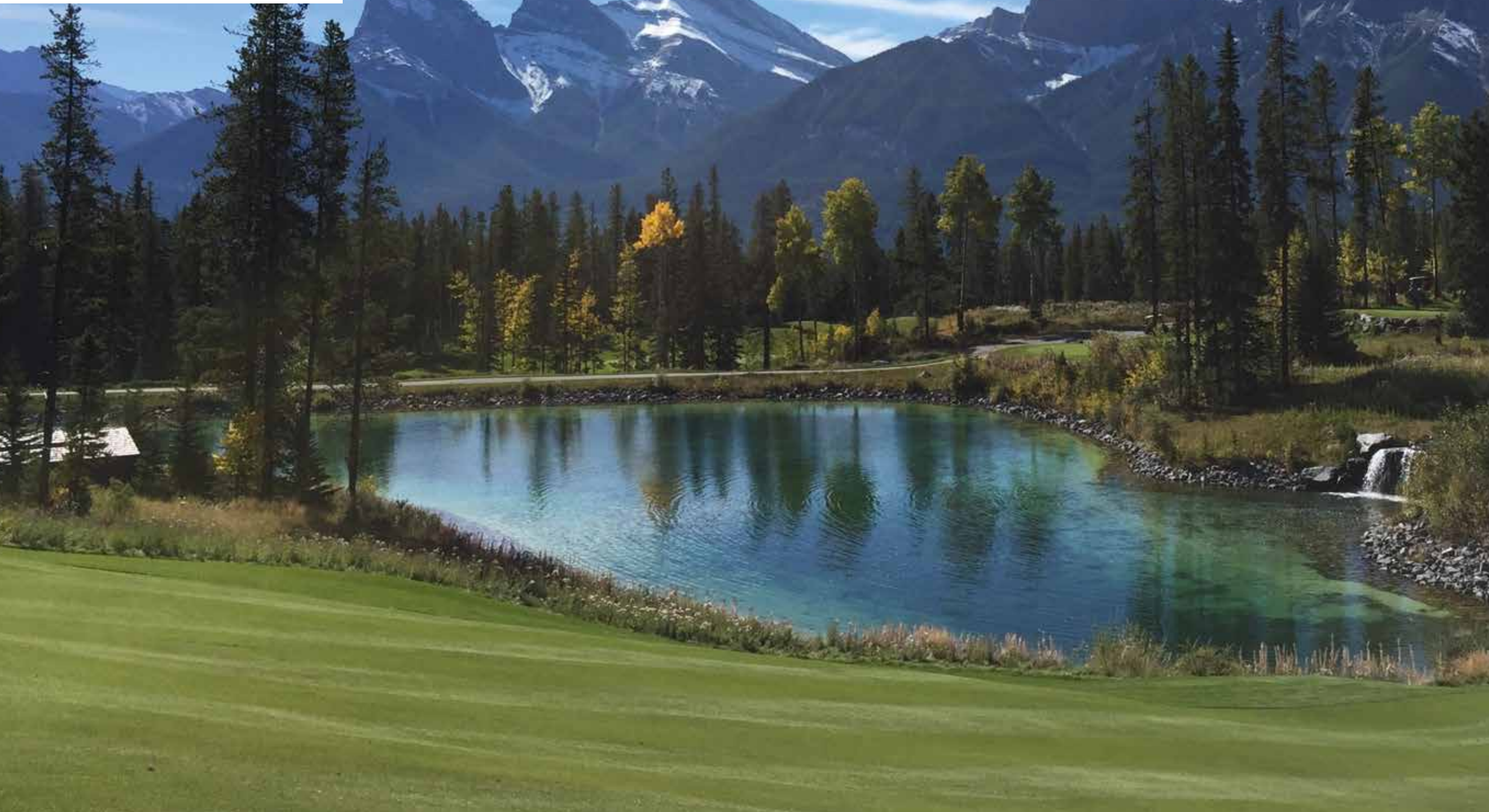
SILVERTIP GOLFCOURSE CANMORE