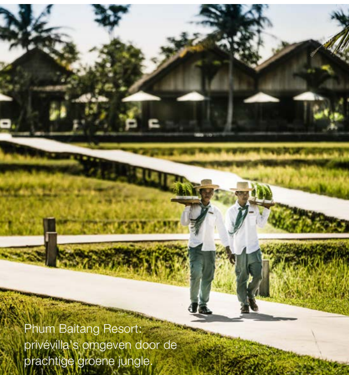
Phum Baitang Resort: privévilla's omgeven door de prachtige groene jungle.