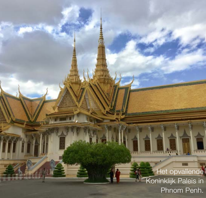
Het opvallende Koninklijk Paleis in Phnom Penh.