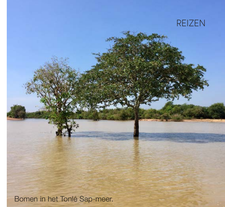
Bomen in het Tonlé Sap-meer.

De tempelcomplexen van de ruïnestad Angkor – UNESCO-beschermde erfgoed – zijn deels overgroeid door de jungle. De boeddhistische en hindoeïstische tempel terreinen zijn indrukwekkend. Het is dan ook druk. Gelukkig kent onze gids, die opgroeide in Siem Reap en als kind in de tempels speelde, nog andere ingangen. Daarnaast laat hij ons enkele minder bekende, maar fraaie tempels zien. Angkor Wat is de heilige hoofdstad en een van de grootste heiligdommen ter wereld. Een bijna oneindig bouwwerk, opgetrokken uit zandsteen met sierlijke torens en binnenhoven. En zo, maar dan weer anders, zien we er nog veel meer tijdens ons verblijf, maar varen we bijvoorbeeld ook langs drijvende kampongs en mangroves richting het Tonlé Sap-meer. 'De eerste keer kom je naar Cambodja voor de tempels, maar je komt terug voor de mensen,' hoorde ik iemand zeggen. En zo is het. □