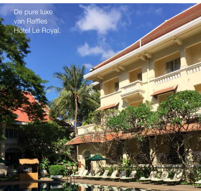
De pure luxe van Raffles Hotel Le Royal.