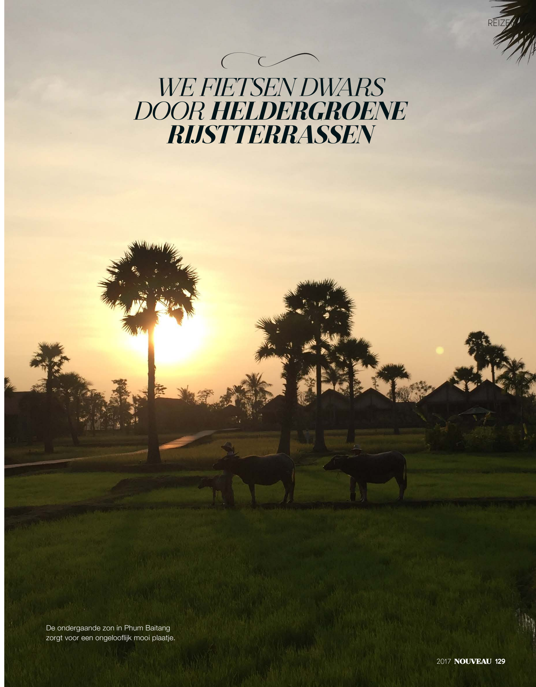
De ondergaande zon in Phum Baitang zorgt voor een ongelooflijk mooi plaatje.