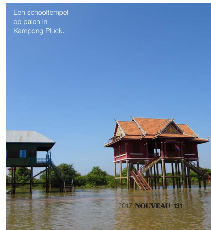
Een schooltempel op palen in Kampong Pluck.