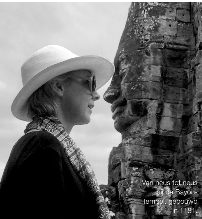
Van neus tot neus bij de Bayon-tempel, gebouwd in 1181.